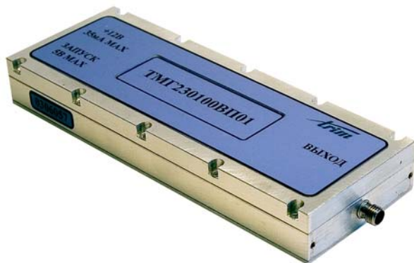
Вариант исполнения генератора