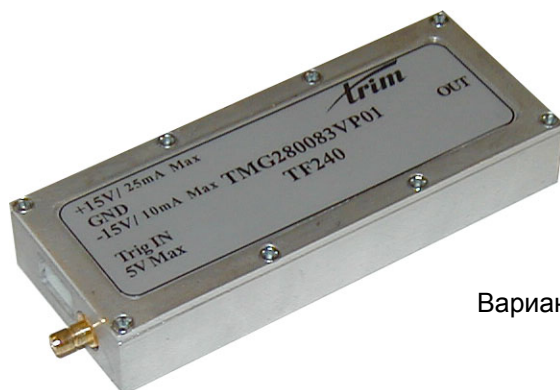
Вариант исполнения генератора