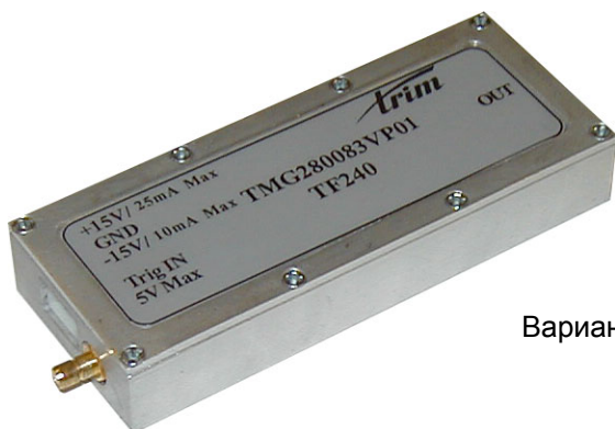
Вариант исполнения генератора